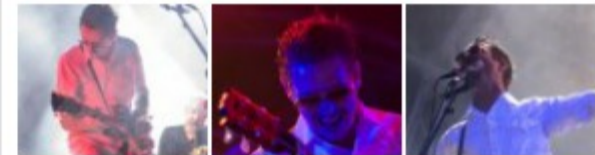
Super Bock Super Rock 2017: 1º dia