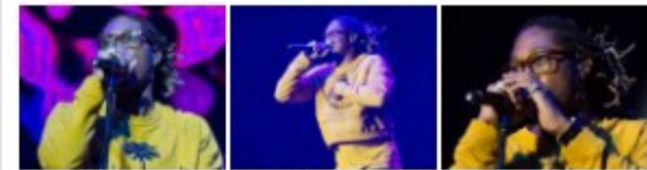
Super Bock Super Rock 2017: 2º dia