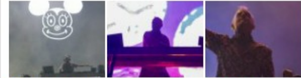
Super Bock Super Rock 2017: 3º dia