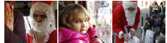
Elétrico do Pai Natal leva crianças a passear por Lisboa