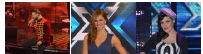
Factor X 2014 - 7ª Gala