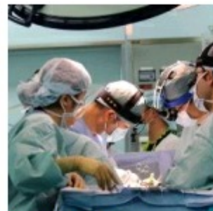
Investigadores de Coimbra recebem bolsa para melhorar o prognóstico do transplante de fígado