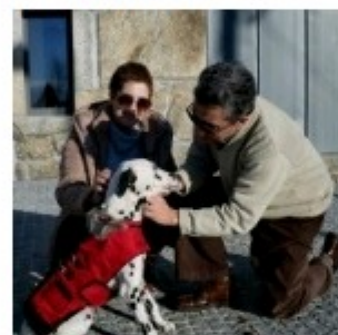
Esposende defende a dignificação dos animais