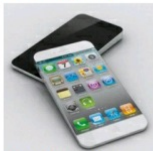
iPhone foi o gadget mais vendido no Natal e Nokia ainda mexe no mercado