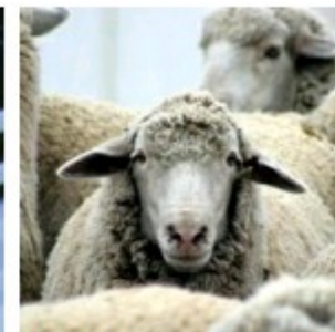
As ovelhas vão ligar o Reino Unido à net por wi-fi