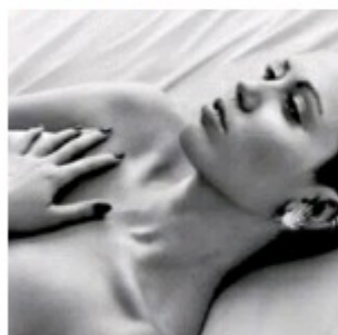
Topless de Miley Cyrus no Instagram durou pouco tempo