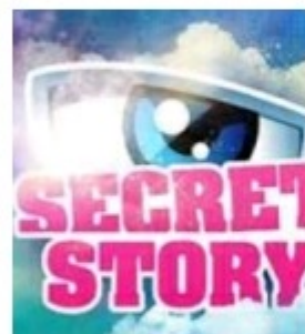
Quem vai ganhar a Casa dos Segredos? Aceitam-se apostas