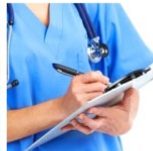
Burla ao SNS: Suspeita de fraude leva PJ a deter dois médicos