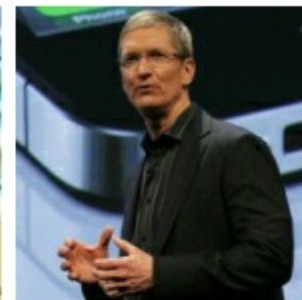
Tim Cook da Apple é o melhor CEO de 214