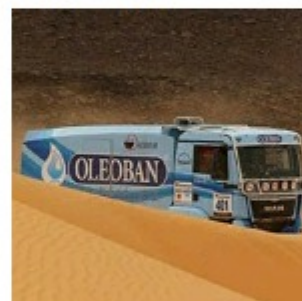
Todo-o-terreno: Elisabete Jacinto começa Africa Eco Race com sexto lugar