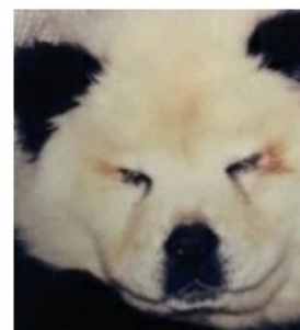
Dois cães disfarçados de pandas levam polícia a fechar um circo